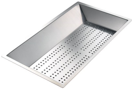
不锈钢穿孔托盘 8156 000