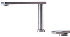
OP 8499 100