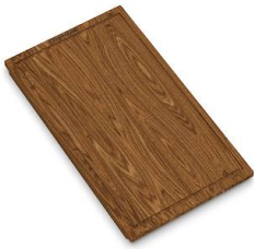
木砧板 8642 004