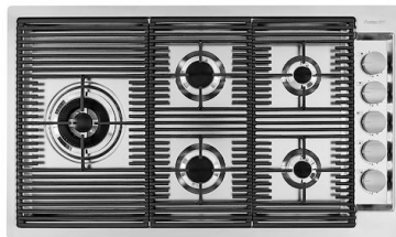
OUTLINE GAS H25 7441 000