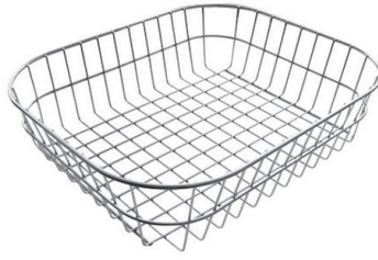
不锈钢篮 8611 000